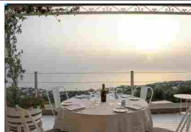
Ischia Charity Dinner, solidarietà e gusto con le creazioni di Slama e Lippi

Al via il progetto DONNE , il Festival della salute e del benessere al femminile, promosso dalla Cattedra Unesco di "Educazione alla Salute e allo Sviluppo Sostenibile" della Università Federico II di Napoli . Sul Lungomare di Napoli, dal 30 giugno al 3 luglio 2021, abbracciate dal Golfo e protetti dal Vesuvio, le donne saranno al centro del primo progetto quadro presentato dalla Cattedra Unesco e condiviso con i vertici dell'Organizzazione. Non "solo" visite gratuite di prevenzione strutturate in percorsi monotematici per le donne di tutte le età, ma quest' anno, grazie al protocollo di intesa tra la Cattedra Unesco e MySocialRecipe , primo portale al mondo di registrazione ricette d'autore, ci sarà anche un'area show cooking tutta al femminile. « Il primo gradino di uno stile di vita sano è la nutrizione. Lo showcooking quindi è un punto fondamentale di educazione alla salute, bisogna comunicare cosa si mangia, quanto si può mangiare e come si deve cucinare, perché tanti errori provengono proprio dalla non conoscenza di