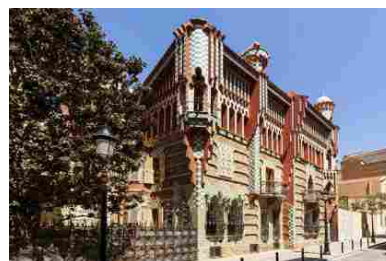
Una notte a Casa Vicens, la prima casa di Gaudí a Barcellona, disponibile solo su Airbnb