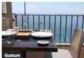
Amitrano fa il bis con l'apertura di un nuovo ristorante "Marina Piccola"