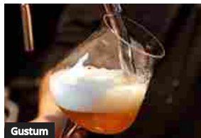
Torna Birra in Villa