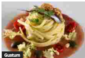
Colatura di alici di Cetara in tour