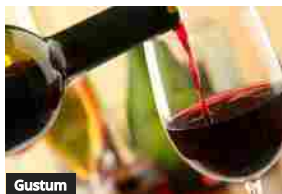
Il vino di Leonardo approda a Guardia Sanframondi